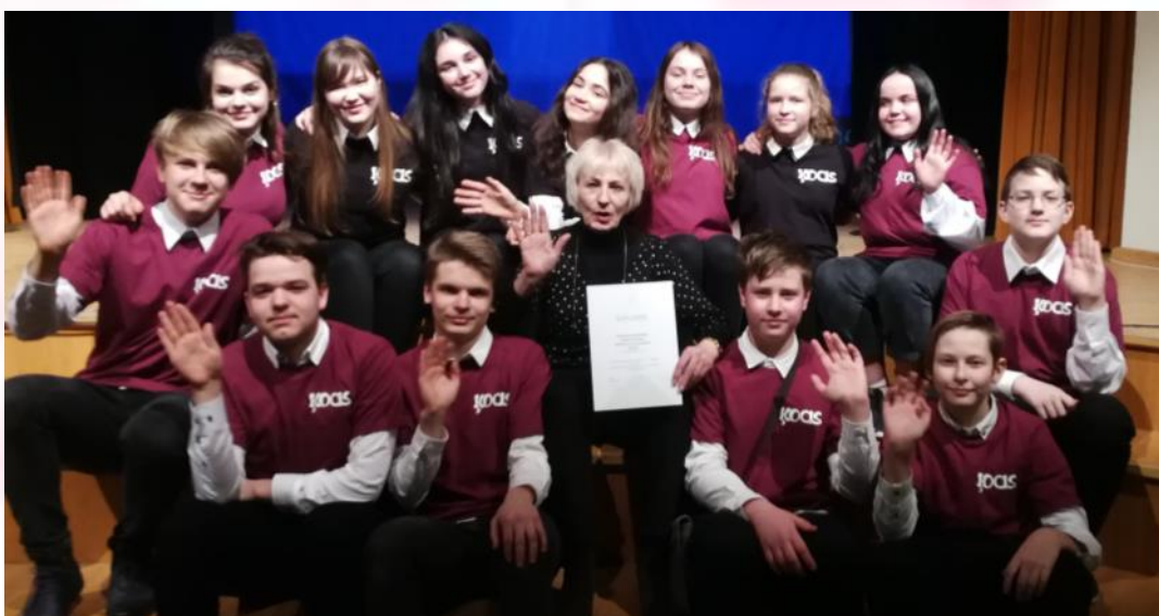
“Ķocis” pēc uzstāšanās

priekšnesumus, domāju par mūsu citu gadu uzvedumiem. Saprātu, ka šis man patīk vislabāk. Iespējams tāpēc, ka jutu kopības sajūtu ar pārējiem. Man šķiet - to deva tas, ka daudz vairāk komunicējam savā starpā un papildinājām viens otra teikto. Tagad saprotu, cik nozīmīga ir sadarbība uz skatuves ne tikai mūsu pašu labsajūtai, bet arī skatītājiem, jo, man šķiet, to no malas var labi manīt.