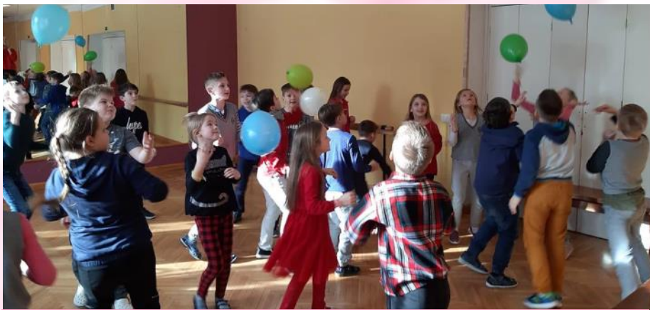
Sākumskolēni ēno vecāku profesijas