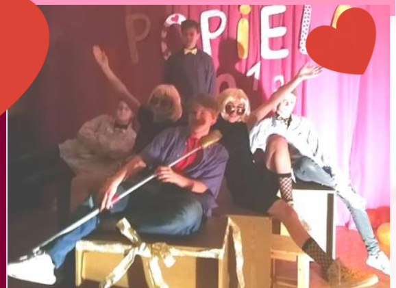
2. vietas ieguvēji - 8. klase!