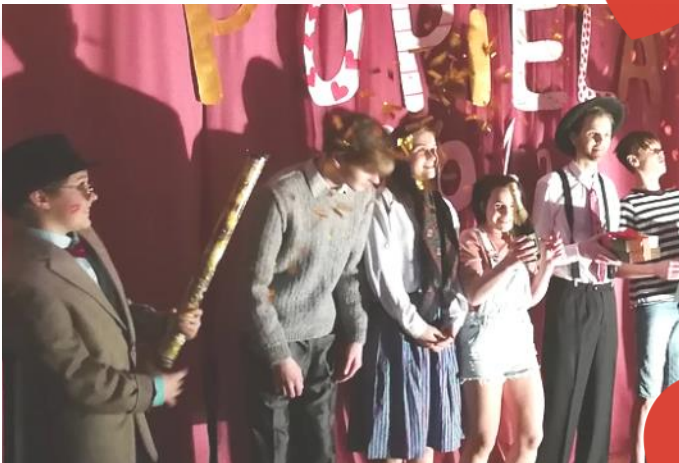
Grand Prix ieguvēji - 9. klase!

Piektdien, 22. februārī notika ikgadējā mūsu skolas Popiela, kuru rīko skolēnu pašpārvalde. Šogad pasākums notika mīlestības noskaņās, jo dalībniekiem bija jāsatavo cienīgs priekšnesums visu laiku labākajām mīlestības dziesmām. Pie žūrijas galda sēdēja 4 profesionāļi – neatkarīgie eksperti.