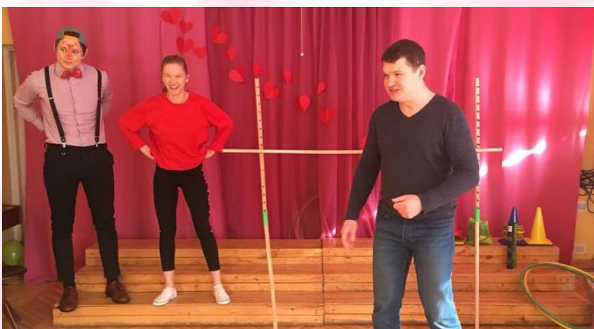
Sākumskolēni ēno vecāku profesijas